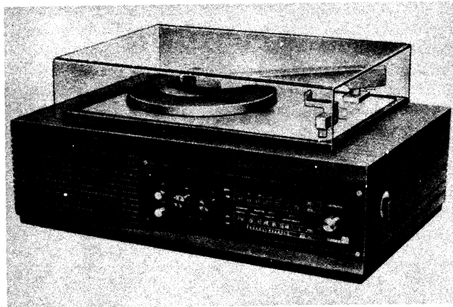
Gramorádio 1024A „BEL CANTO“, výroba 1972 až 1973

Při příjmu kmitočtově modulovaných signálů: přípojka pro vnější anténu — souměrný obvod antény, indukci vázaný s vf obvodem naladěným na střed