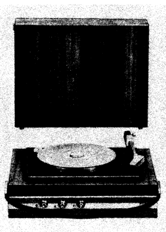
Kufříkový gramofon GZ 110, výroba 1968 až 1970

Ostatní vybavení kufříkového gramofonu: Gramofon: čtyřrychlostní (HC 11), otáčky gramofono-