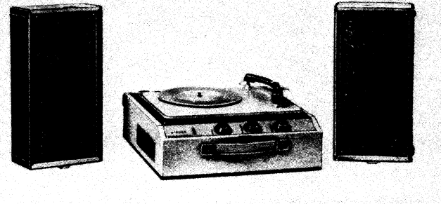
Kufříkový gramofon GZC 641A, výroba 1965 až 1968

Gramofon: čtyřrychlostní (HC 643), otáčky gramofonového talíře 78, 45, 33 \frac{1}{3} , 16 \frac{2}{3} 1/min, automatické vypínání motoru radiálním posuvem raménka přenosky. Přenoska: stereofonní, piezoelektrická (VK 311 MNS III), se dvěma safírovými hroty, k přehrávání gramofonových desek s úzkou a širokou drážkou. Reproduktory: dva, oválné, rozměry 130 \times 205 mm, impedance kmitací cívky 4 \Omega (v oddělených skříních).